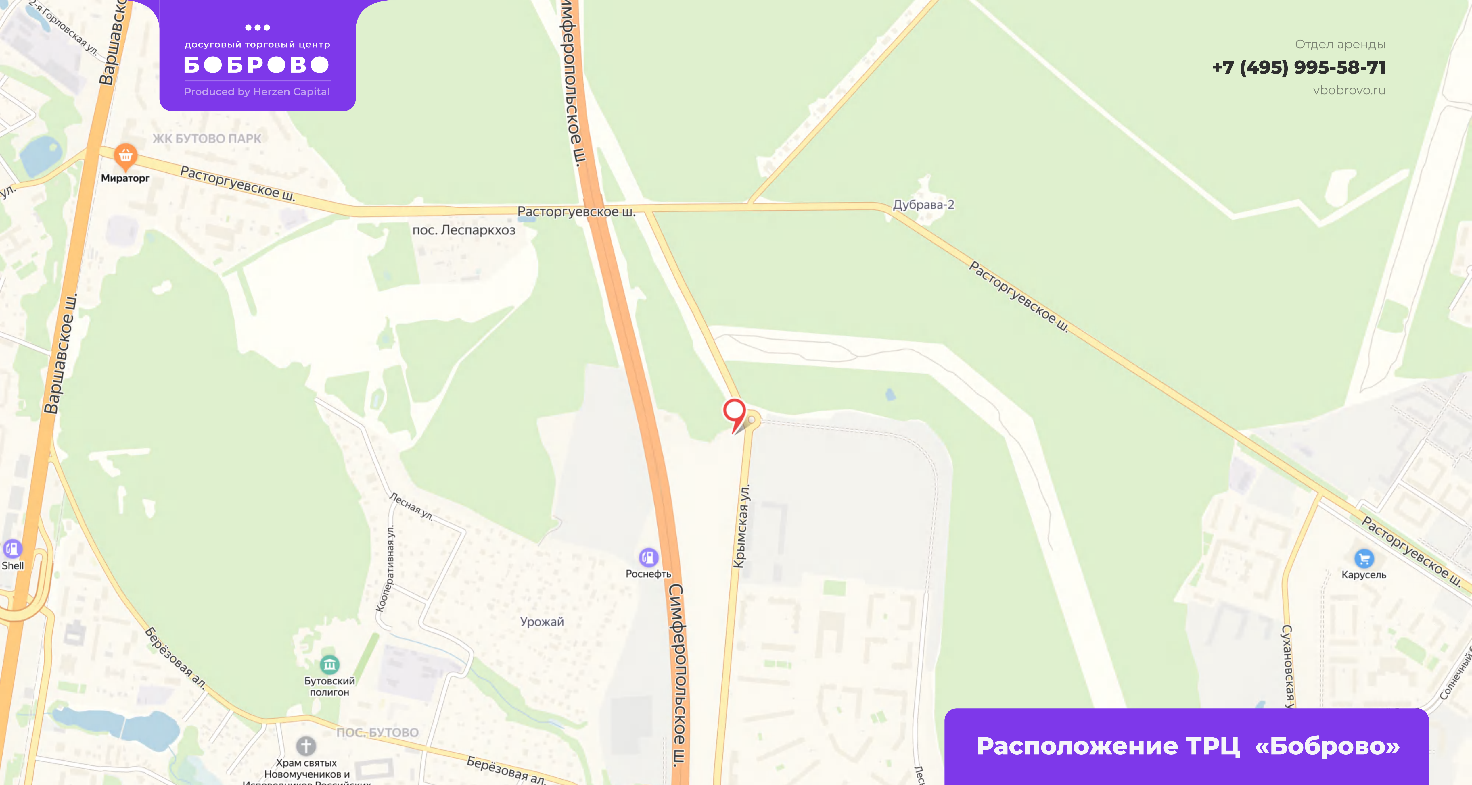
Расположение ТРЦ «Боброво»

Отдел аренды +7 (495) 995-58-71 vbobrovo.ru